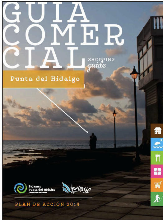
Portada Zona Punta del Hidalgo. V.1