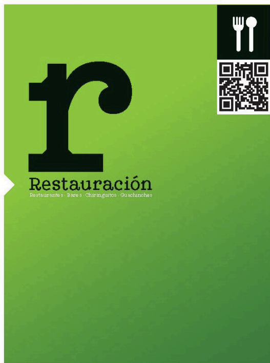
Página Entrada Categoría